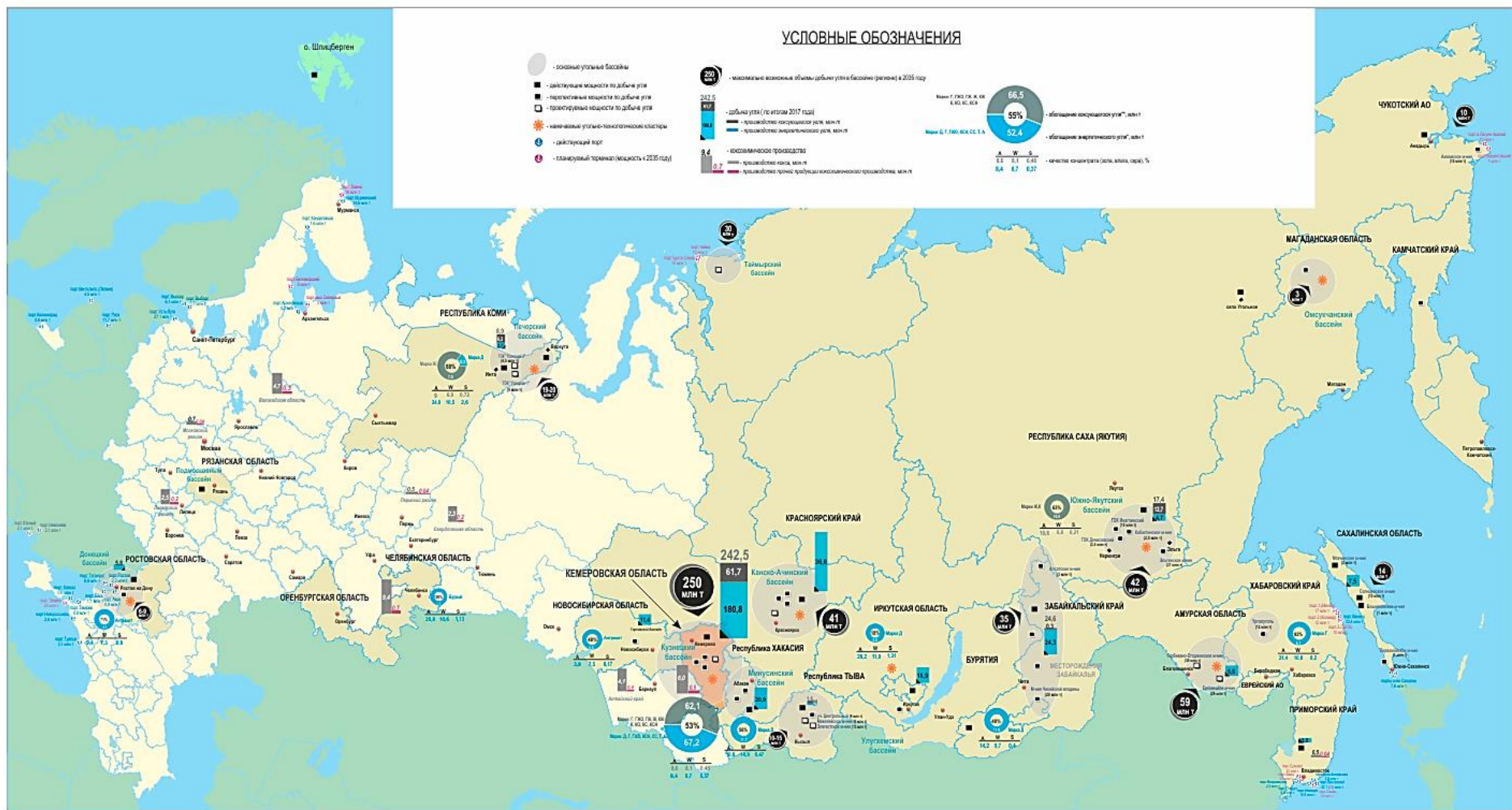
Рисунок 1.2 – Пространственное развитие угольной промышленности России – новые месторождения и центры угледобычи (максимально возможные объемы добычи угля, исходя из проектных проработок)